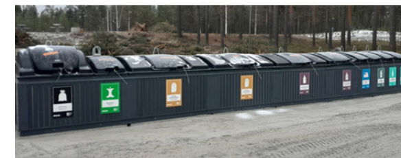
Exempel på färdig station